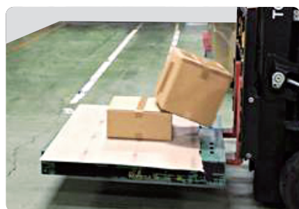
ストツバくん未使用