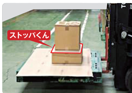
ストツバくん使用