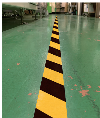
危険 / 区画表示用として