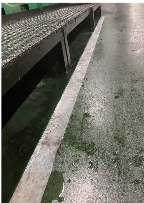
工場内でのラインテープとして