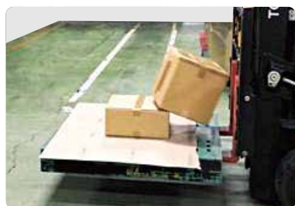
ストツバくん®未使用