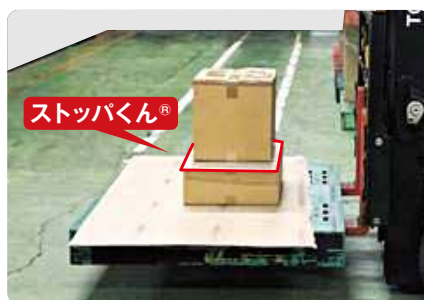
ストツバくん®使用